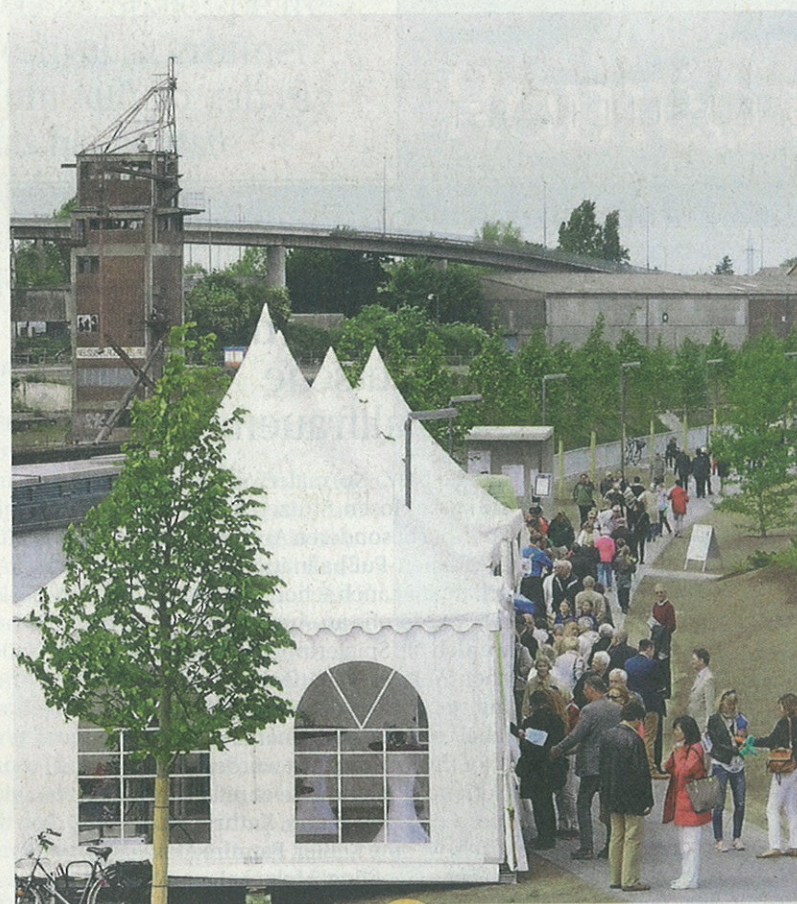
In Pagodenzelten gab es unter anderem Informationen zum Hafen. Auf den braunen Flächen soll in ein paar Wochen Rasen wachsen.