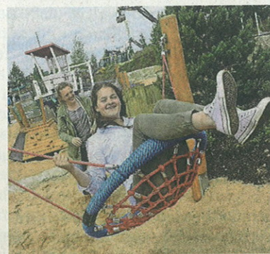
Die Spielplätze kamen bei den Besuchern gut an.