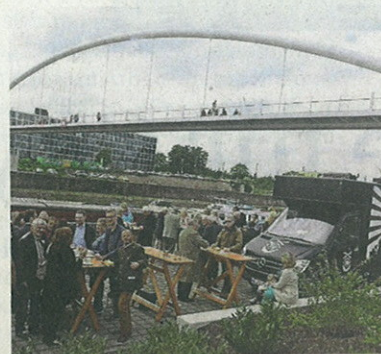
Auch die neue Brücke fand viel Lob unter den Gästen.